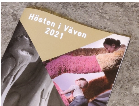
Ett fullmatat höstprogram, för stora som små!

– Jag ser fram emot att få fira Umeå 400 år tillsammans med Umeåborna på alla möjliga sätt!