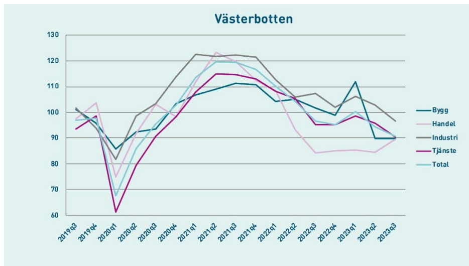
Figur 1. Konfidensindikatorn tas fram genom en företagsenkät och mäter nuläget i näringslivet samt hur företagen ser på den närmaste framtiden (källa Norrlandsfondens konjunkturbarometer 2023 )