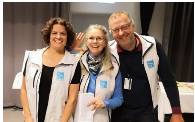
Sporren på besök