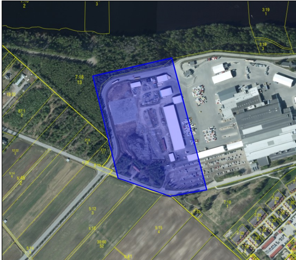
Figur 1. Preliminär avgränsning av planområdet