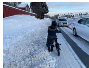
Bilder föreställande gångvägens framkomlighet vintertid 9:e mars 2017, 7:e januari 2018 samt 18:e februari 2022, dagen efter detaljplaneförslaget utställande till samråd.