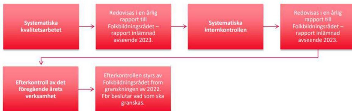
Bild av Folkuniversitetets verksamhetsuppföljning från deras hemsida.

Efterkontroll innebär att utföra granskning av föregående års verksamhet genom verksamhetsstatistik från SCB, kvalitativa redovisningar från förbunden samt i vissa fall uppföljningsbesök. En rapport lämnas till Folkbildningsrådet med föregående års synpunkter och problem som ska tas hänsyn till under internkontrollen av nästa verksamhetsår.